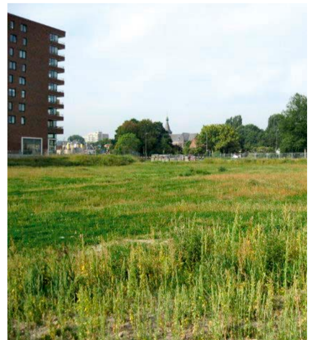
Hier komt Schoutenhoek Fase 2